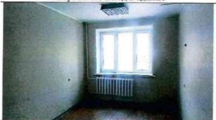
Рисунок 6.8 Состояние помещений