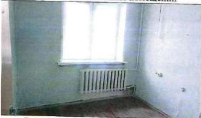
Рисунок 6.12 Состояние помещений