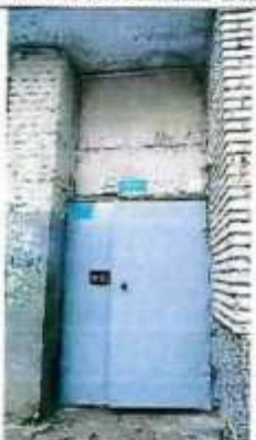
Рисунок 6.6 Вход в здание