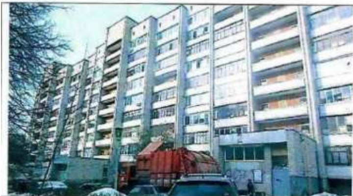
Рисунок 6.4 Внешний вид здания