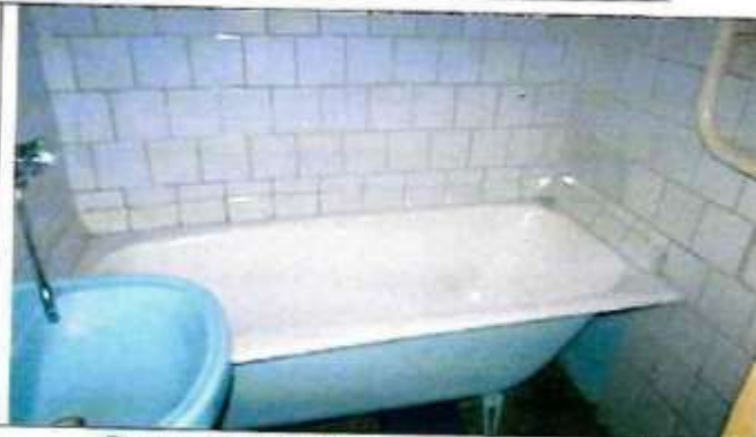
Рисунок 6.11 Состояние помещений