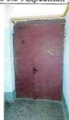
Рисунок 6.7 Вход в помещение