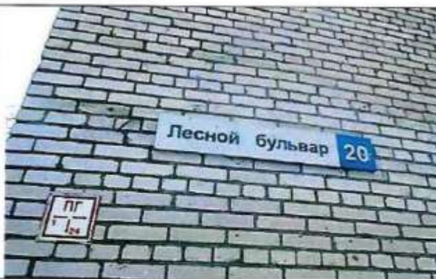
Рисунок 6.5 Адресный указатель