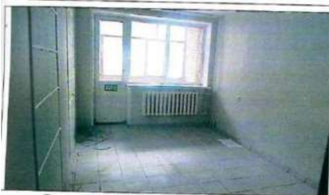
Рисунок 6.10 Состояние помещений