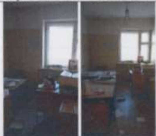
Рисунок 6.7 Состояние помещений