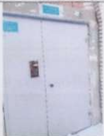
Рисунок 6.6 Вход в здание