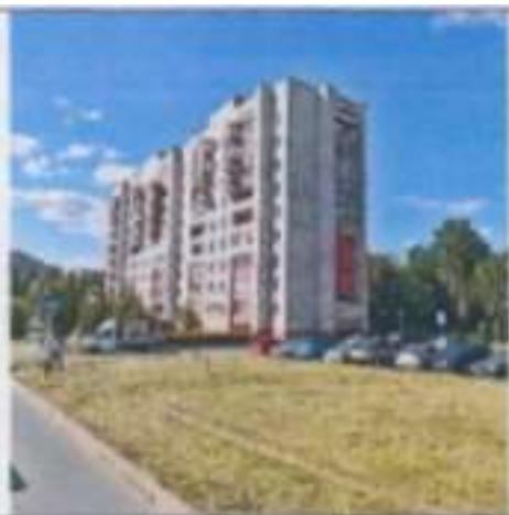
Рисунок 6.5 Внешний вид здания