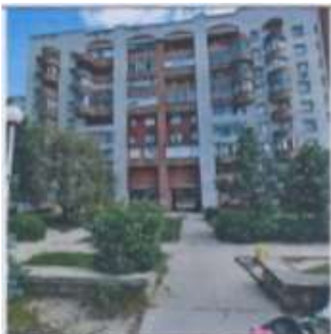
Рисунок 6.4 Внешний вид здания